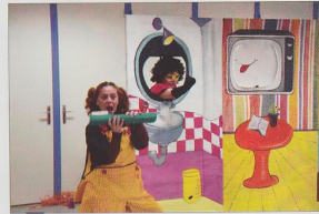
Une leçon de brossage de dents drôle et tonique.